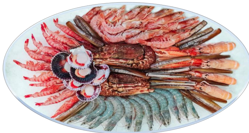
* Pack Especial Parrilla Congelado recomendado para 4 personas